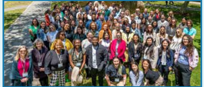
Los orientadores del Estudio HBCD, junto con otros miembros del equipo de investigación, en una capacitación de grupo en mayo de 2024.

Ya sea responder preguntas sobre el estudio, ofrecer orientación o simplemente estar presentes cuando se les necesita, los orientadores del estudio desempeñan un papel esencial al ofrecer apoyo personalizado a los participantes del Estudio HBCD. Los orientadores del estudio sirven como modelos a seguir, mentores, educadores y defensores, asegurándose de que los participantes sientan que los escuchan y los apoyan en cada paso del proceso.